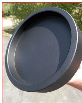
Cloche fond plat Ø 150mm