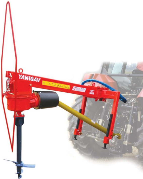
Prince avec Pare fil et vrille de plantation