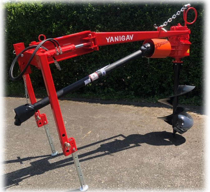
TAMD 245 au stockage